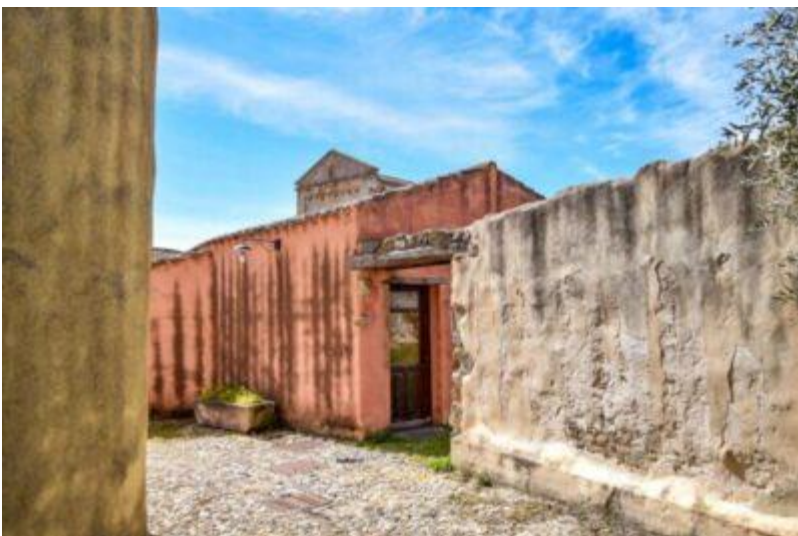
Borgo medievale di Tratalias_Sardegna (SU)