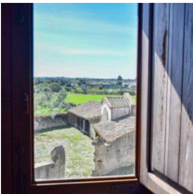
Borgo medievale di Tratalias_Sardegn (SU)