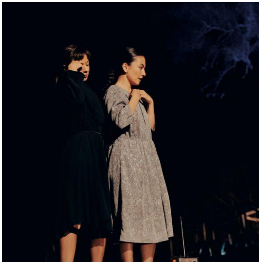
Blue Sunday_Compagnia Oltrenotte

Danza, luoghi e connessioni, per connettere artisti e spazi diversi, tra scoperta, rigenerazione e nuova funzionalità degli spazi.