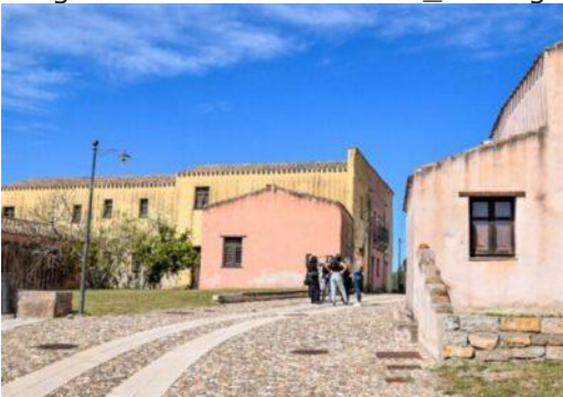
Borgo medievale di Tratalias_Sardegn (SU)

https://www.oltrecolonne.it/dialoghi-e-danza-nellantico-borgo-di-tratalias-con-cortoindanza-logos-e-laltra-sardegn/