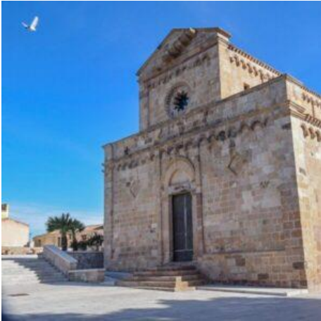
Chiesa di Santa Maria_Tratalias (SU)