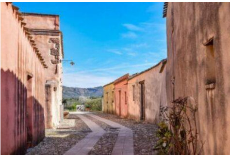
Borgo medievale di Tratalias_Sardegn (SU)